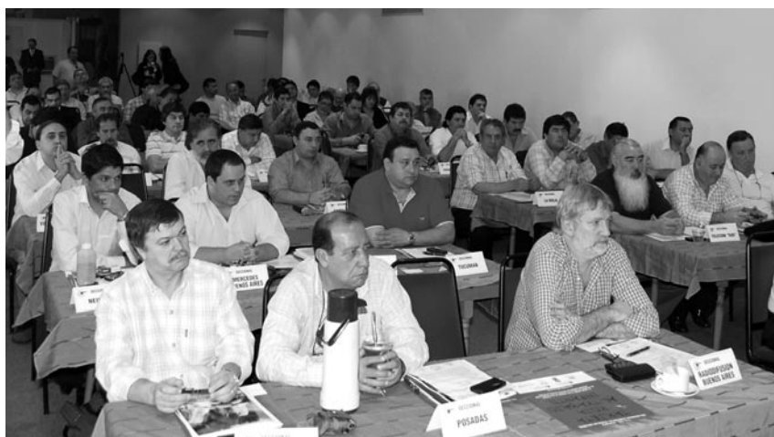
Delegados congresales de la AATRAC en plena deliberación

El documento final señala que “en las reflexiones mantenidas estuvo presente el análisis de la realidad global donde se visualizó la gran crisis financiera y económica por la que atraviesan varios países, en especial los europeos, producto de la aplicación de recetas neoliberales que imperaron en nuestra región en la década del 90, crisis de la cual nuestro país está saliendo con políticas heterodoxas de defensa a ultranza del trabajo y la producción”. También se abordaron, tal como indica la Declaración, “aspectos que hacen a la vida institucional de nuestro país en lo político, en lo económico y en lo social”. Señalaron “la participación de nuestra organización en el movimiento obrero, y en especial de nuestra organización, en el proceso de la discusión y sanción de la ley 26.522 de servicio de comunicación audiovisual”. Y proclamaron “la urgente estatización del Correo de bandera”. Se recordó que el 3 de septiembre se cumplirán 7 años del decreto que firmara el entonces, Presidente de la Nación, Dr. Néstor Kirchner. “Es un anhelo expresado por el conjunto de los Delegados Congresales que para el próximo aniversario, contemos con una decisión definitiva, para que los Trabajadores del Correo Argentino podamos demostrar al país y al mundo entero que somos capaces de administrarnos por nosotros mismos y