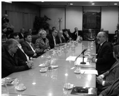
El SAT reunido con Tomada

En el documento que firmaron, las partes dejaron en claro que “el uso y abuso de sustancias psicoactivas constituye una problemática social que también impacta en el mundo del trabajo y las relaciones laborales ya que