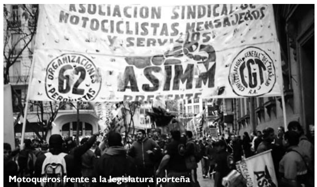
Motoqueros frente a la legislatura porteña