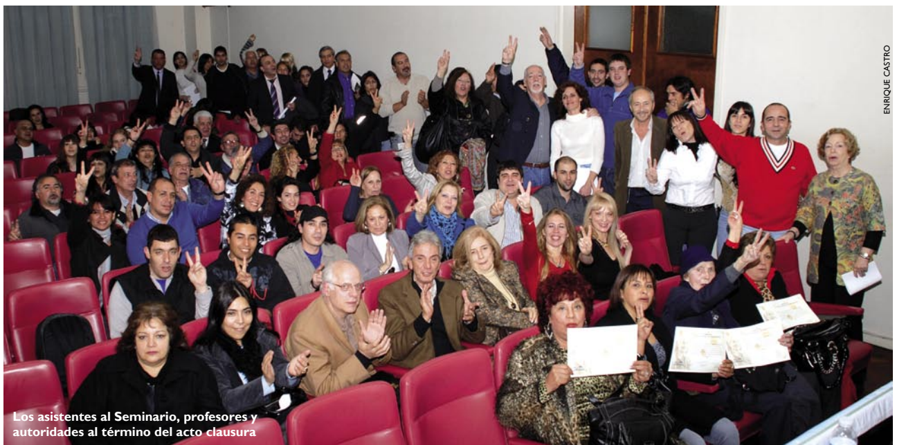
Los asistentes al Seminario, profesores y autoridades al término del acto clausura