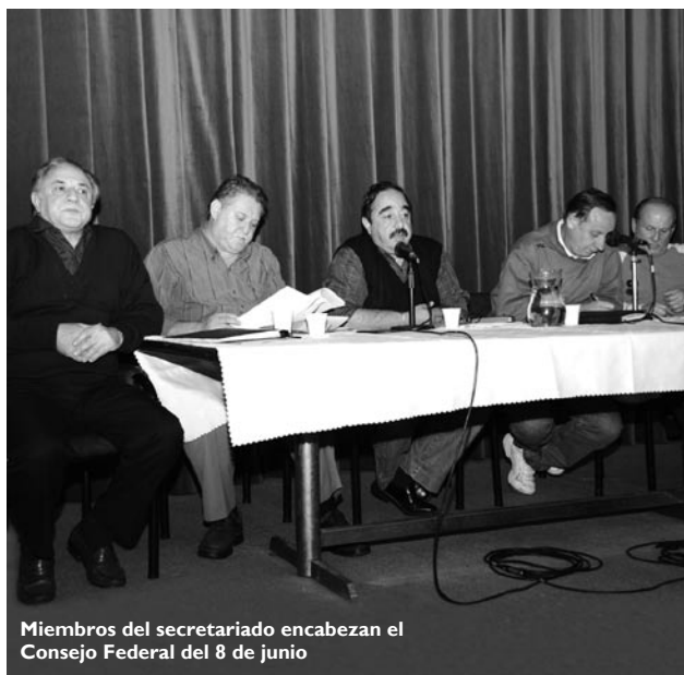
Miembros del secretariado encabezan el Consejo Federal del 8 de junio

Los gremios telefónicos destacaron la actitud de Telecom de calificar las medidas de acción como ilegítimas.