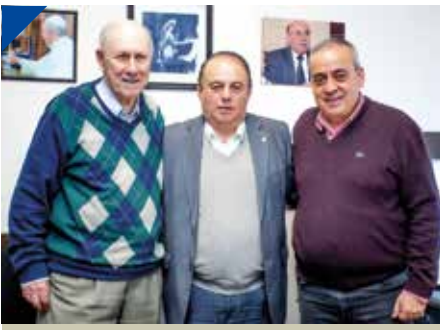
Contundente apoyo en las urnas a Palacios en la AATAC. PÁG. 6