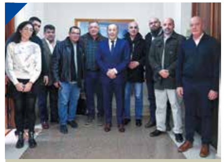
Químicos y Petroquímicos visitan a Adolfo Rodríguez Saá. PÁG. 29