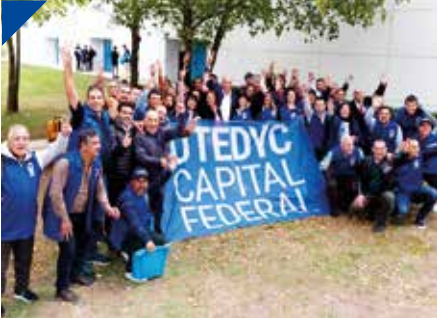
UTEDYC Capital presente en el 56º Congreso Nacional. PÁG. 6