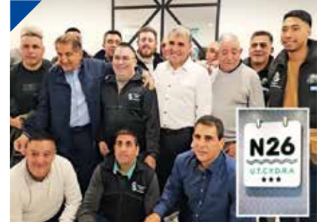
CARGA y DESCARGA inauguró su Hotel N26 en Mar del Plata. PÁG. 23