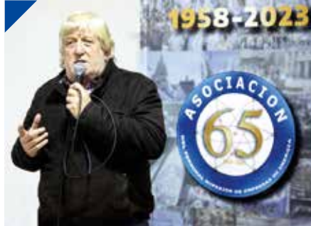
La APSEE celebró 65 años de Historia y Lucha. PÁG. 12