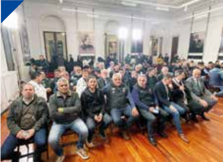
FEMPINRA coronó en La Rosada la baja del Decreto 870/18. PÁG. 29