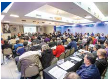
El 74º Congreso de la FOEESITRA fortalece su accionar. PÁG. 18