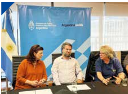
VIALES rubrican convenio con el Ministerio de Trabajo. PÁG. 27