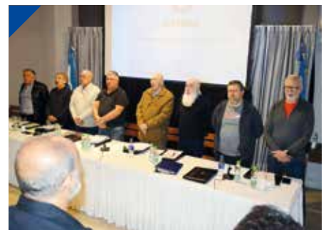
AATRAC: "La organización como instrumento de lucha". PÁG. 6