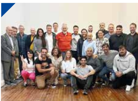
FUERZA ARGENTINA presentó el libro "Conocer a Perón. PÁG. 34