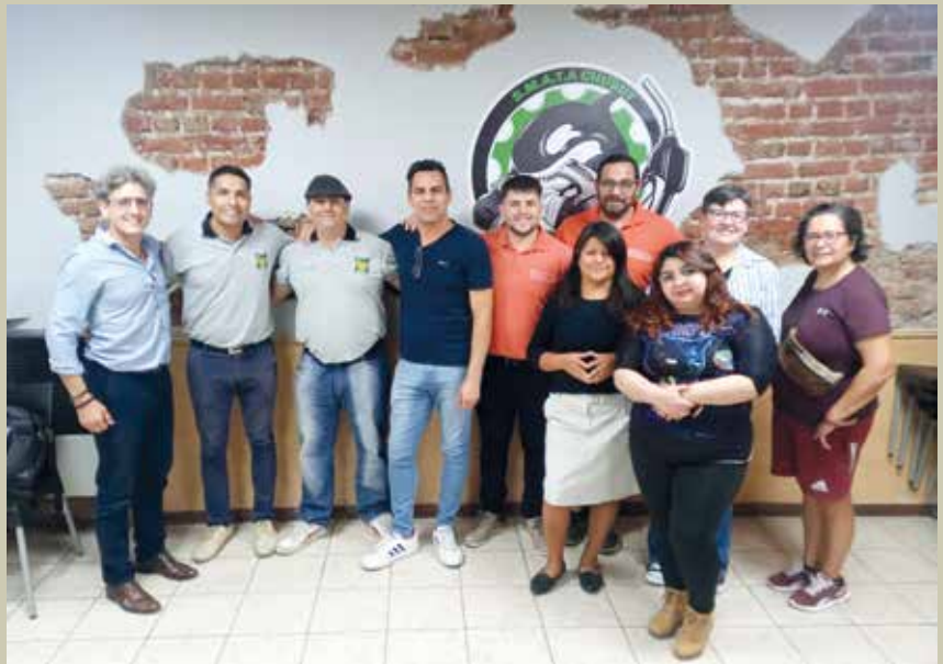
▶ FATFA: NUEVA CD EN EL SINDICATO DE TRABAJADORES DE FARMACIA DE CHUBUT

Desde la UATRE informaron que este atraso en el acuerdo mensual se produjo a raíz del cambio de autoridades en la Secretaría de Trabajo de la Nación, motivo que dio lugar a que se dilate seriamente las negociaciones.