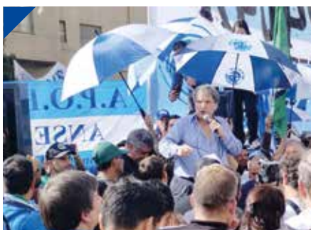
APOPS marchó y demandó a la ANSES por los despedidos. PÁG. 22