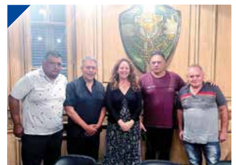
SOECRA inició una nueva etapa con la renovada CD . PÁG. 28