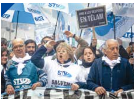
VIALES: A 23 años del Salvemos a Vialidad Nacional. PÁG. 27