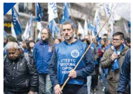
UTEDYC cumplió el 19 de julio 78 años de lucha. PÁG. 6