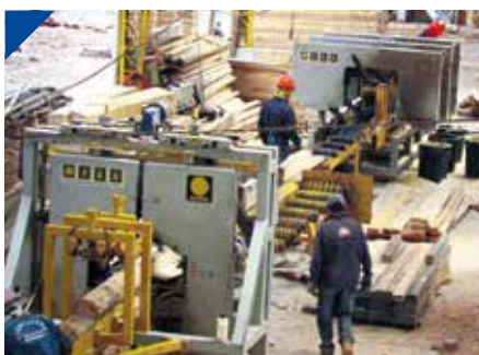
MADEREROS evocan el mensaje de Perón en su Día. PÁG. 10