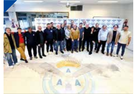
Alianza de gremios Aeronáuticos y Universitarios. PÁG. 34