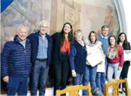
Cerró el Ciclo Turismo Sindical de la CGT en el Vallese. PÁG. 26