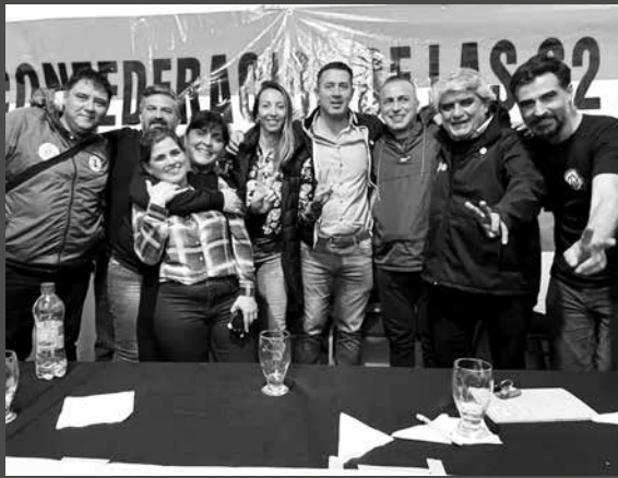
► LA REGIONAL MORENO DE LAS 62 DE PARIENTE NORMALIZADA