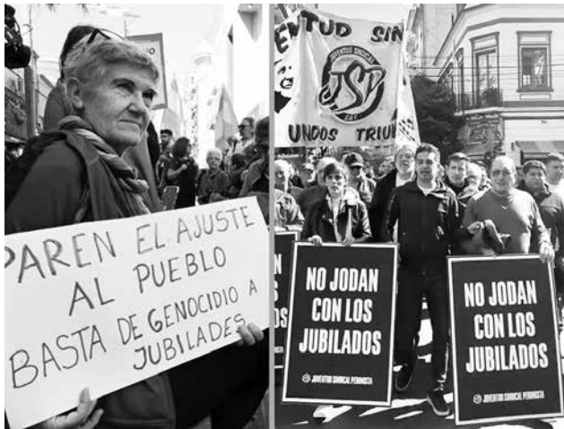
► LA JUVENTUD SINDICAL MARCHÓ JUNTO A LAS Y LOS JUBILADOS