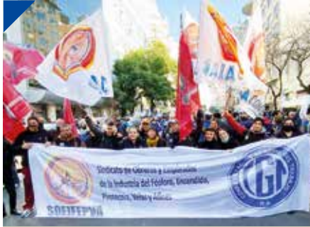
El Sindicato del Fósforo celebra su 80º Aniversario. PÁG. 13