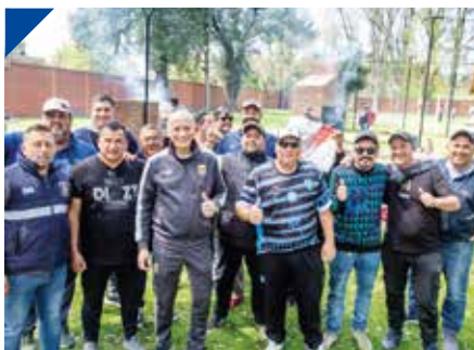
Día del Capataz Portuario del Interior. PÁG. 12