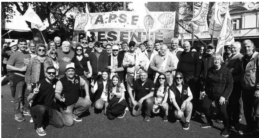
► LA APSEE MARCHÓ FIRME EN DEFENSA DE LA UNIVERSIDAD PÚBLICA Y ACCESIBLE