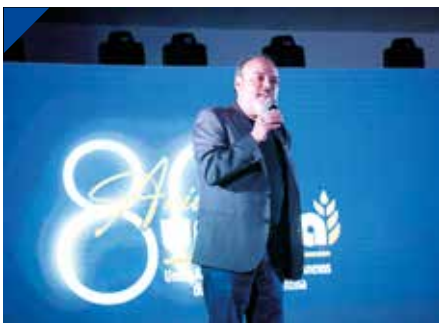
Recibidores de Granos en su 80º Aniversario. PÁG. 27