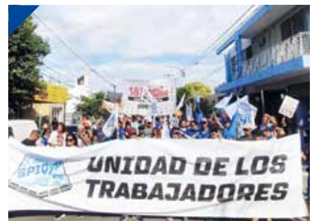
FESTIQPRA y Químicos de Río III dan lucha. PÁG. 23