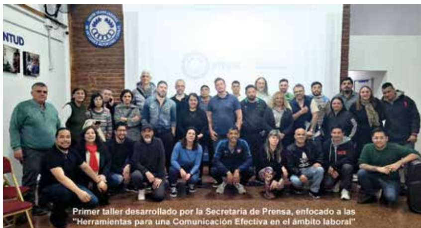
Primer taller desarrollado por la Secretaría de Prensa, enfocado a las "Herramientas para una Comunicación Efectiva en el ámbito laboral"