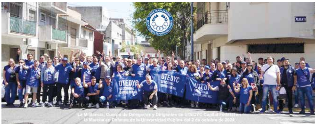
La Militancia, Cuerpo de Delegados y Dirigentes de UTEDEC Capital Federal en la Marcha en Defensa de la Universidad Pública del 2 de octubre de 2024