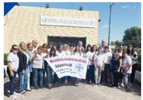
1º Encuentro de Mujeres de la Sanidad platense PÁG. 16