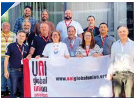
FOESITRA en la 6ta Conferencia de UNI Américas PÁG. 15