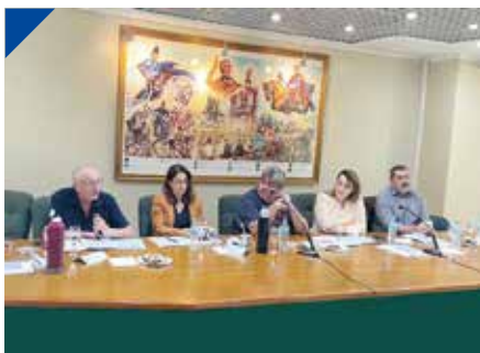
CSIRA: Sin industria argentina no hay empleo. PÁG. 22