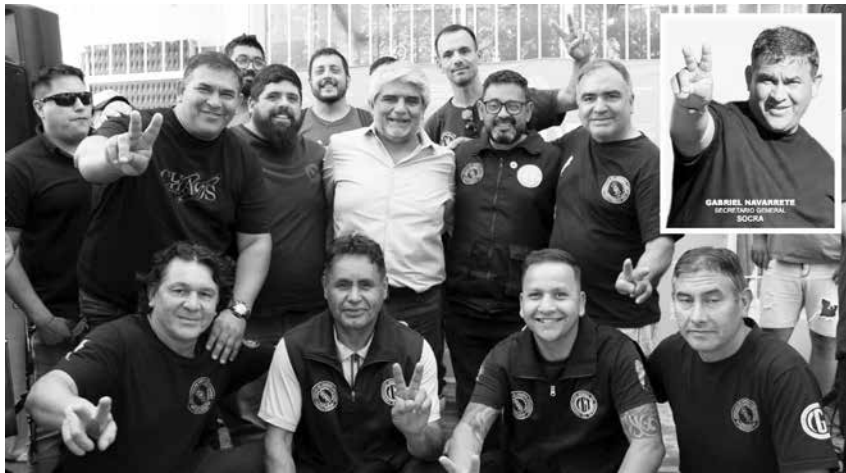
► EL SINDICATO DE OBREROS CURTIDORES, EN EL LUGAR DONDE HAY QUE ESTAR