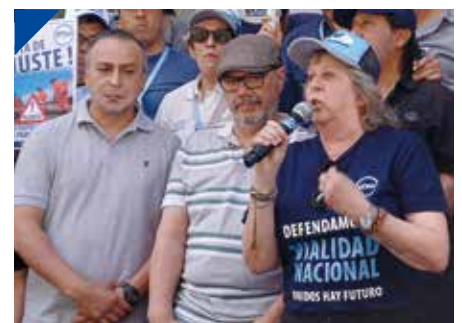
STVyARA: "Vialidad Nacional no se recicla". PÁG. 4