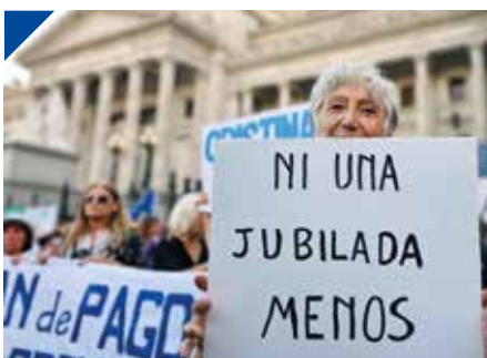
APOPS: "El fin de la Moratoria" Previsional. PÁG. 24

Medidas de gobierno traen desempleo, cierre de fábricas y pymes. PÁG 18