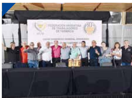
FATFA: "La Unidad Federal es la que nos fortalece". PÁG. 14