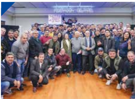
PAPELEROS puso en escena "La clase obrera también piensa". PÁG. 12