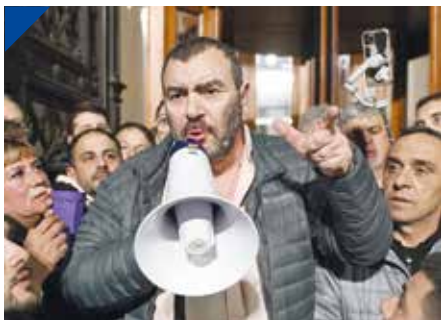
APL: DI PRÓSPERO reelecto con un triunfo rotundo en las urnas. PÁG. 30