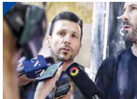
BREY: La derrota de LLA en las urnas "Un límite al ajuste de Milei". PÁG. 23