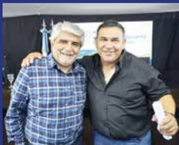
► SG SOC CONCEJAL EN F. VARELA