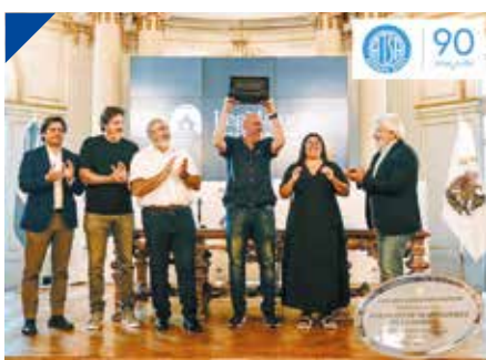
Legislatura de CABA homenajea los 90 años de ATSA Bs. As. PÁG. 15