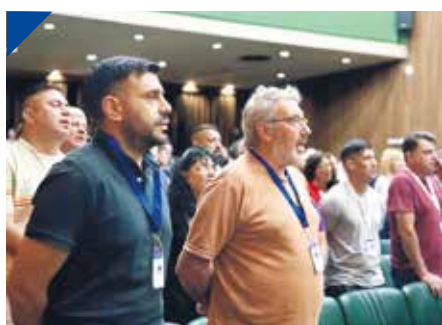
FESTIQYPR contra el industricidio en el Congreso de la CSIRA. PÁG. 22

Es por ahí, es con políticas que privilegien producir en nuestro país. PÁG 18