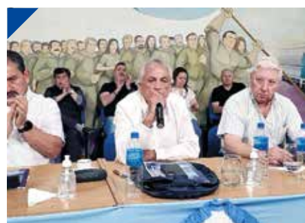
Benítez (AOT): La motosierra vino para la Industria Nacional. PÁG. 23