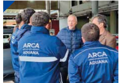
El SUPARA advierte al Gobierno que "Sin Aduana no hay Nación". PÁG. 22