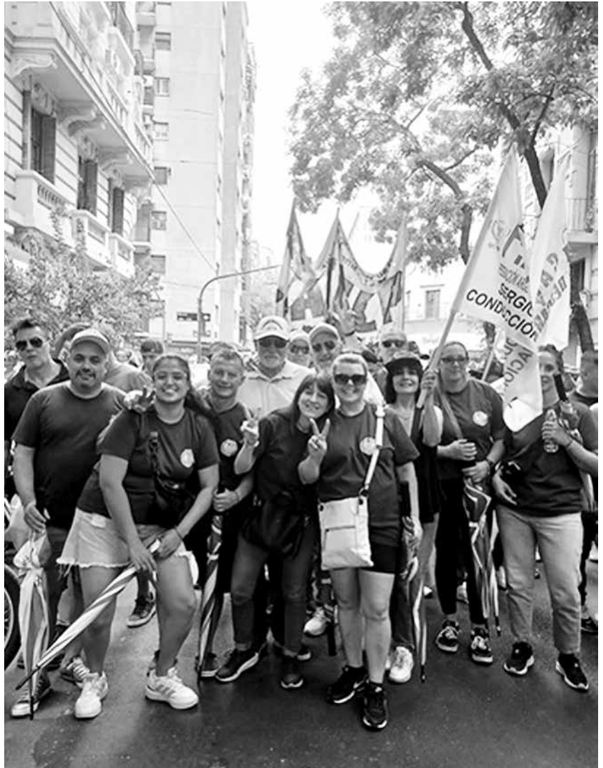
FATFA en la marcha del 11/2 contra la Reforma Laboral

El conductor de la FATFA remarcó que estas medidas también tendrán consecuencias en el sector de farmacia, donde miles de trabajadores dependen de convenios colectivos que garantizan condiciones laborales dignas. “Cuando se debilita la negociación colectiva o se abaratan los despidos, lo que se genera es mayor inestabilidad laboral”, advirtió. Y agregó que se trata de “una actividad con niveles de rentabilidad importantes, por lo que resulta aún más injustificado avanzar sobre derechos laborales en lugar de fortalecer condiciones de trabajo más justas y