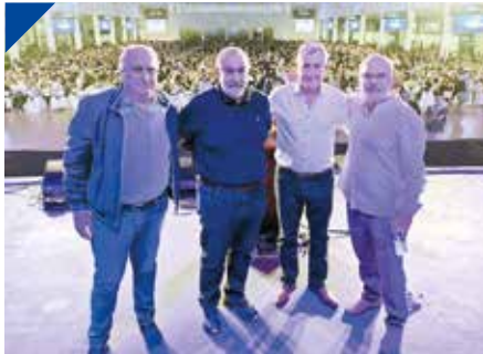
SSP festejó el Día del Trabajador de Salud Pública el 8 de marzo. PÁG. 21